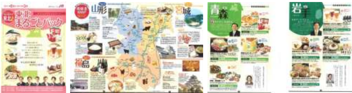
▲観光地情報と地域産品をリンク ▲県ごとに商品を詰合せ

このため、北海道・東北未来戦略会議が同社に協力し、各県や物産協会等と連携しながら、観光の情報発信と併せて地域製品を販売する「東北まるごとパック」を企画・制作。JTBの全国約1,000店舗で販売した。