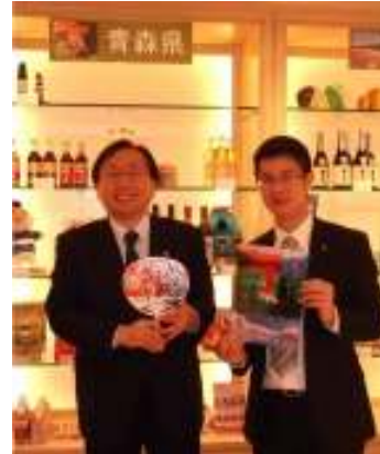
▲来店された三村知事