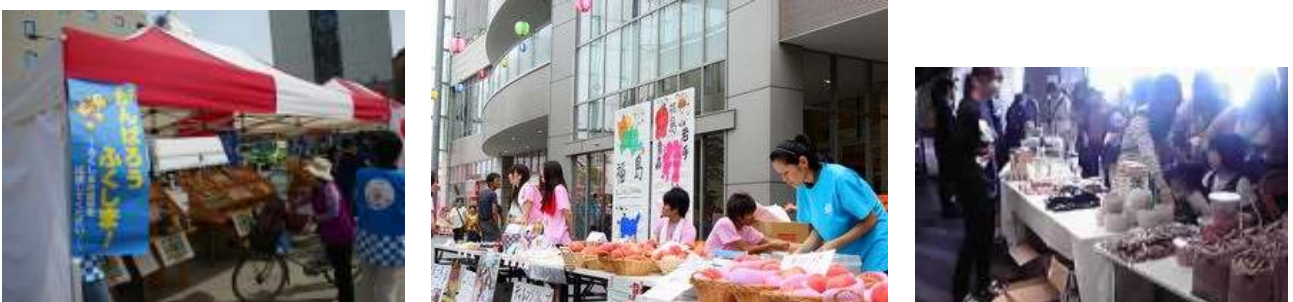
▲マルシェジャポン名古屋

地域製品の購入を通じ、被災地を応援したいとする声が多く寄せられているものの、現地で売り場を提供するのみの場合も多く、被災地側の企業・生産者の負担となるケースが散見されたことから、北海道・東北未来戦略会議は、主催者側と協議し、日本通運株式会社の協力を得て、地域産品の集約・販売を支援した。